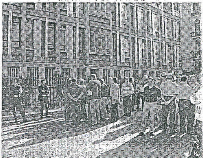
Una manifestazione per il caso-amianto dei lavoratori veneziani

— impegnato in un superlavoro per le commesse di grandi navi da crociera — resterebbe con metà organico, perdendo centinaia di lavoratori professionalizzati che con i benefici previdenziali previsti dalla legge sull'amianto raggiungerebbero in un baleno il diritto all'andare in pensione. All'Enichem — dove sono oltre 300 le domande presentate dai patronati sindacali all'Inps — l'ipotesi che centinaia di dipendenti usufruiscono dello «sconto pensione» per l'amianto risolverebbe invece molti problemi, in primo luogo quello dei circa 700 «esuberanti» esistenti nel cantiere e preventivati nei tagli da fare a livello nazionale in tutto il gruppo chimico. Stessa situazione ai cantieri dell'Arsenale, in liquidazione e con un gran problema d'esuberanti, dove pochi giorni fa, a sorpresa, sono stati riconosciuti 67 casi di lavoratori «espo-